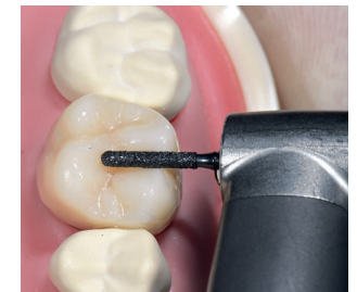
Vorbereitung zum okklusalen Trennen einer Molar-Vollkeramikkrone aus Zirkonoxid