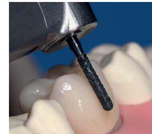
Vorbereitung zum bukkalen Trennen einer Molar-Vollkeramikkrone aus Zirkonoxid