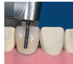
Vorbereitung zum labialen Trennen einer Frontzahn-Vollkeramikkrone aus Zirkonoxid