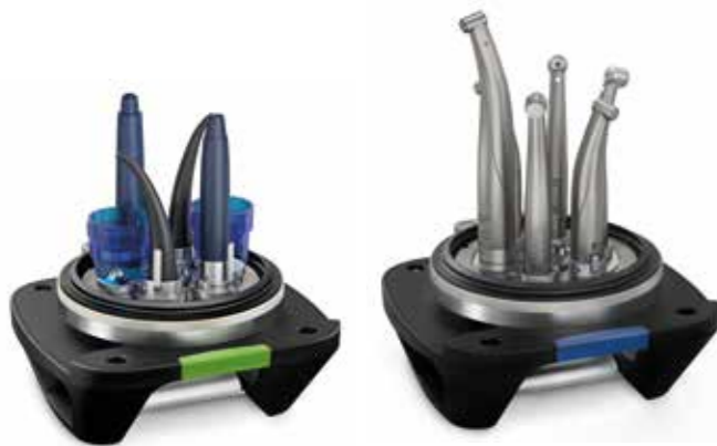
Deckel grün optional