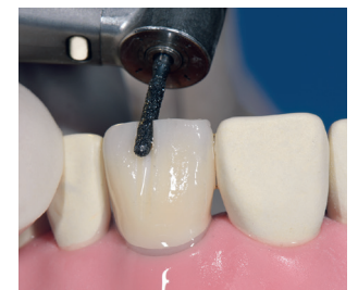
Première incision après 5 sec. de découpe

* Découpe initiale: Les instruments Intensiv découpent en 45 sec. 3 mm de zircon comparé à 1,6 mm par des instruments comparables de la concurrence industrielle allemande.